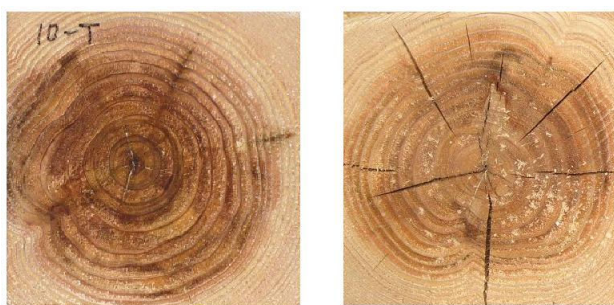
図-3 内部割れ (左: 高温低湿処理、右: 高温乾燥)

通常の高湿乾燥では図-3写真右のように内部割れが発生しますが、今回行った短期間の高温低湿処理では髄における割れはみられるものの高湿乾燥でみられるような顕著な内部割れは図-3写真左のとおり発生しませんでした。